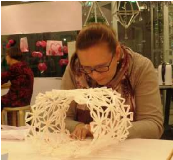
Yksilöllisen valaisimen tekeminen on tempaus- tut mukaansa monen käsityön harrastajan.

Senioreiden käsityökerhot jatkuivat yhteistyössä Ok-opintokeskuksen kanssa. Kaikissa käsityökeskuksissa järjestettiin koululaisille taitoviikkoja ja erilaisia työpajapäiviä. Kurssitoimintaan saatiin tukea myös Kansan Sivistystyön Liitto KSL ry:ltä. Uusia kursseja esiteltiin asiakasilloissa, joita järjestettiin 3 kertaa jokaisella paikkakunnalla.