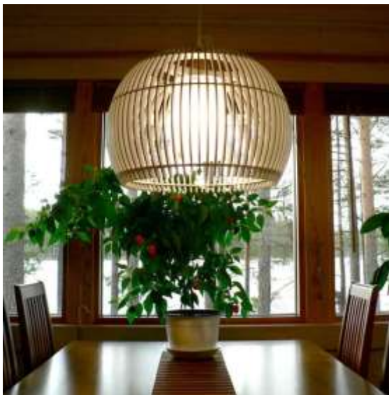
Kuvassa palkitun Visapajan valaisin.